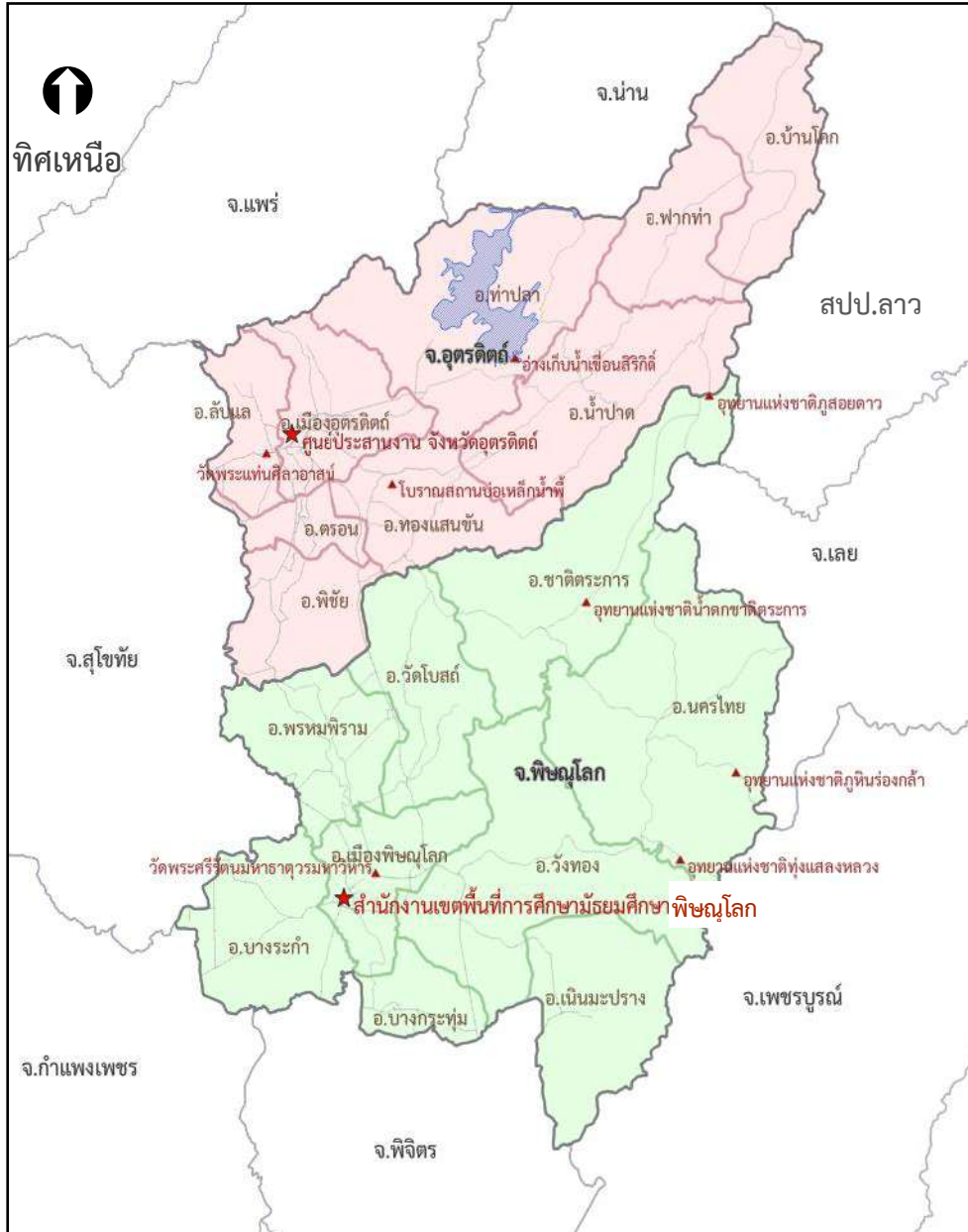
รูปที่ ๑ แสดงที่ตั้งและพื้นที่รับผิดชอบของสำนักงานเขตพื้นที่การศึกษามัธยมศึกษาพิษณุโลก อุตรดิตถ์

ตั้งอยู่ที่ถนนเลี้ยวเมืองพิษณุโลก - สุโขทัย ตำบลท่าทอง อำเภอเมืองพิษณุโลก จังหวัดพิษณุโลก รับผิดชอบการจัดการศึกษาของโรงเรียนมัธยมศึกษาที่เปิดสอนระดับชั้นมัธยมศึกษาตอนต้นและชั้นมัธยมศึกษาตอนปลาย ในจังหวัดพิษณุโลก จำนวน ๓๙ โรงเรียน และจังหวัดอุตรดิตถ์ จำนวน ๑๘ โรงเรียน รวมทั้งสิ้น ๕๗ โรงเรียน