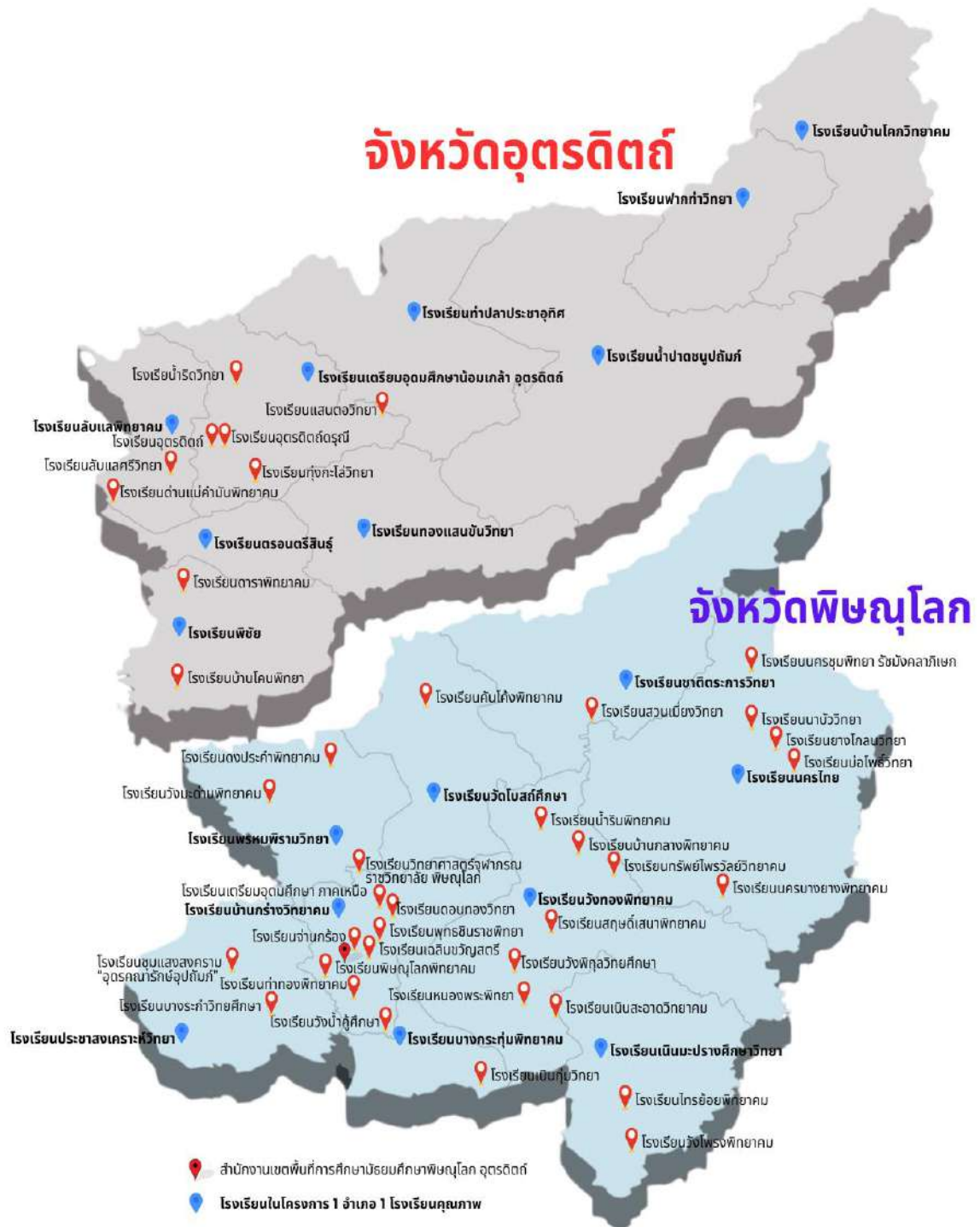
รูปที่ ๒ แสดงแผนที่ตั้งโรงเรียนในสังกัดสำนักงานเขตพื้นที่การศึกษามัธยมศึกษาพิษณุโลก อุตรดิตถ์