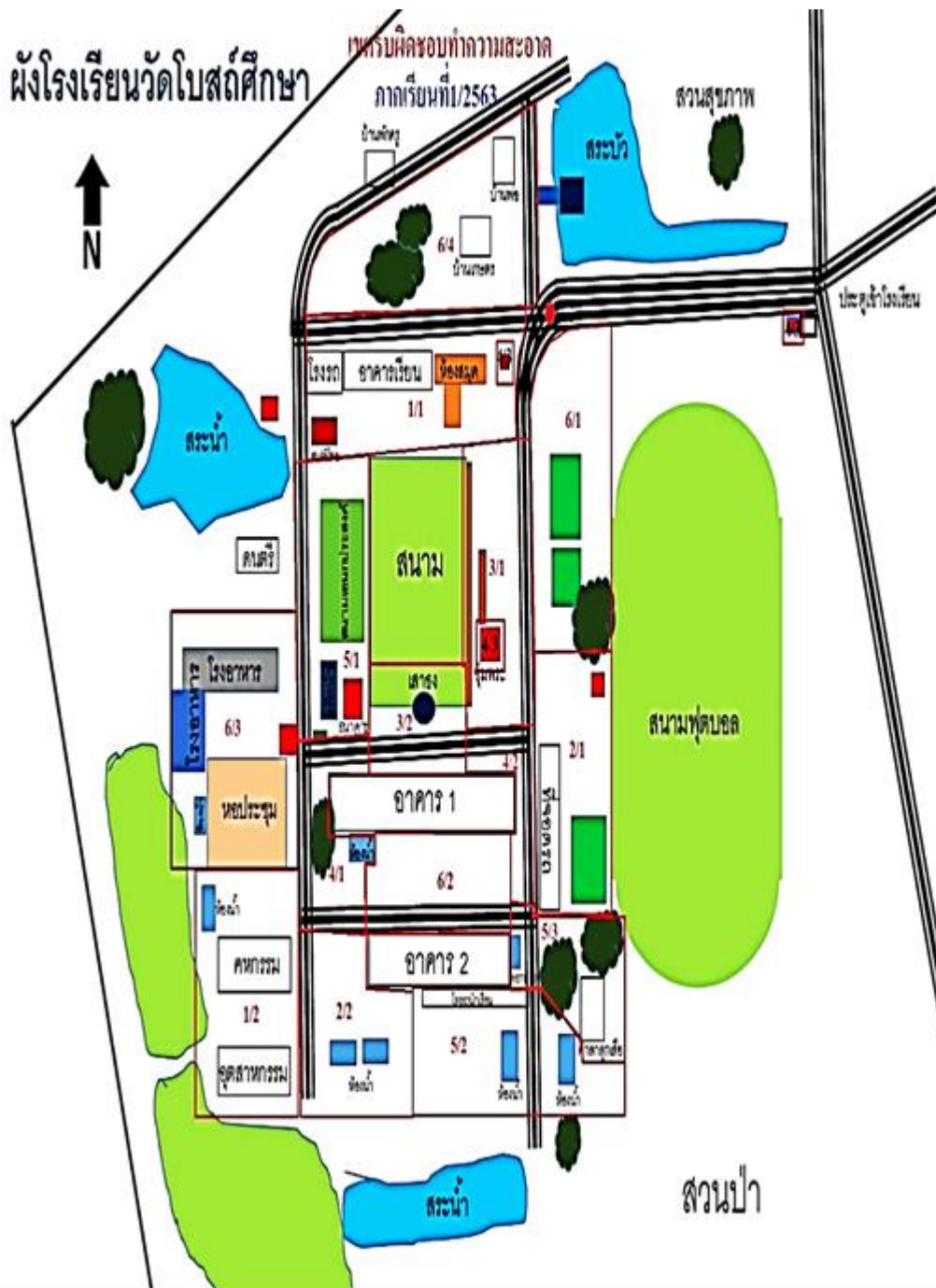
แผนผังโรงเรียนวัดโบสถ์ศึกษา. แสดงที่ตั้งอาคารเรียนและอาคารประกอบ