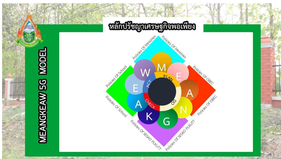
แผนผัง Meangkaew ๕G Model ของโรงเรียนสวนเมี่ยงวิทยา

W = Work team for sufficiency Economy หมายถึง การทำงานเป็นทีมของบุคลากรครูในโรงเรียนร่วมกับผู้เกี่ยวข้อง